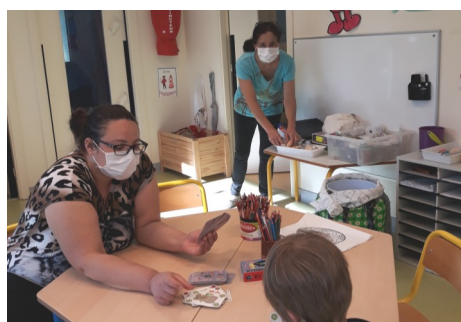
Accueil des enfants des soignants