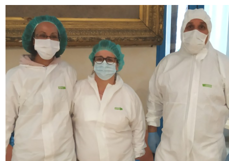
Équipe d'entretien des locaux