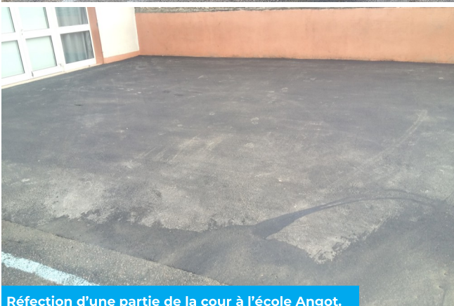
Réfection d'une partie de la cour à l'école Angot.