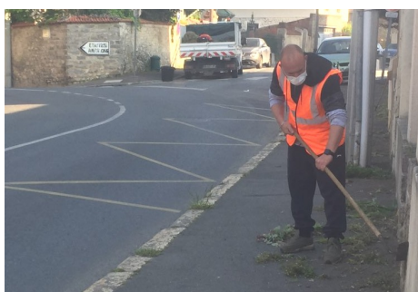
Entretien de la ville