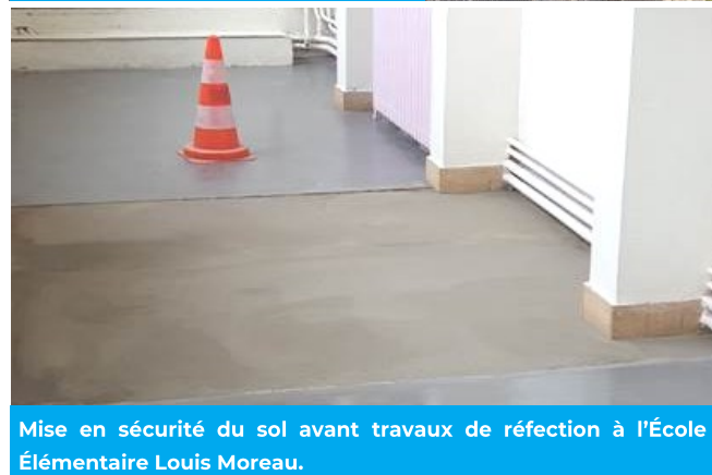
Mise en sécurité du sol avant travaux de réfection à l'École Élémentaire Louis Moreau.