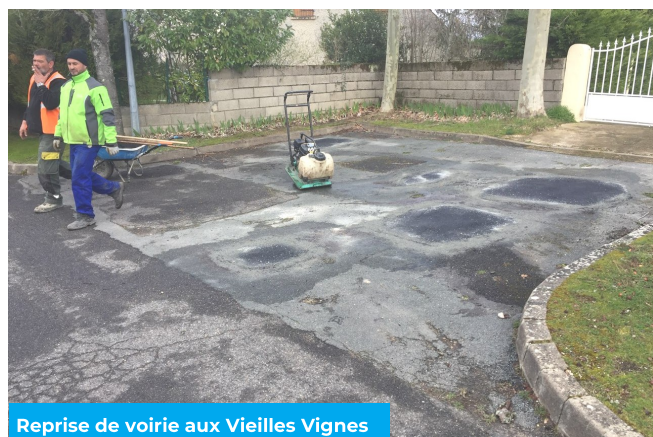
Reprise de voirie aux Vieilles Vignes